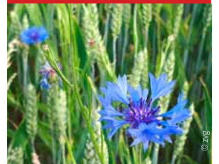
Alle eure Dinge lasst in der Liebe geschehen. 1. KOR. 16, 14