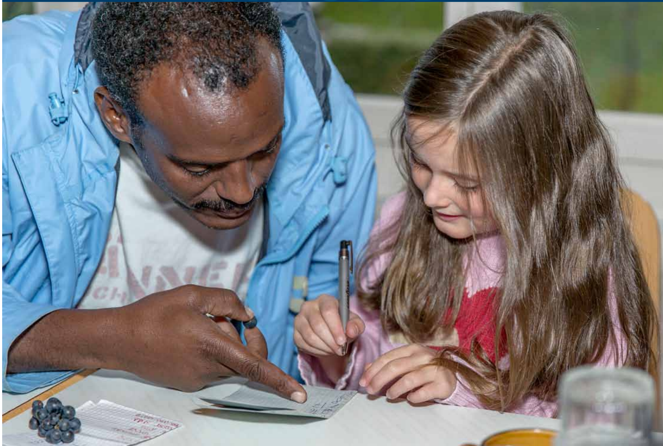
Café Regenbogen, Riggisberg 2014

REGIONALREDAKTION Susanne Hosang, 079 754 43 76, susanne.hosang@artyco.ch