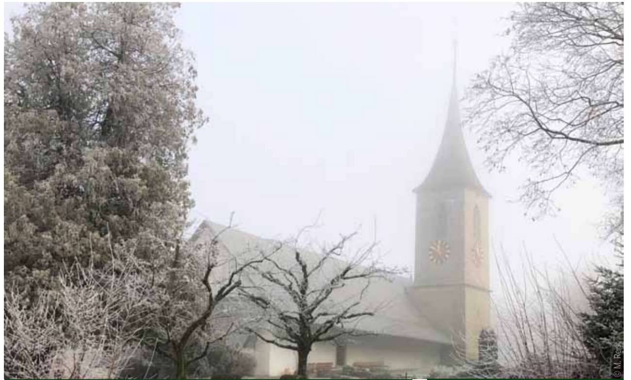
MUSIKALISCHES IN DER KIRCHE

Weihnachtsgottesdienst für Kinder und Erwachsene am 3. Advent.